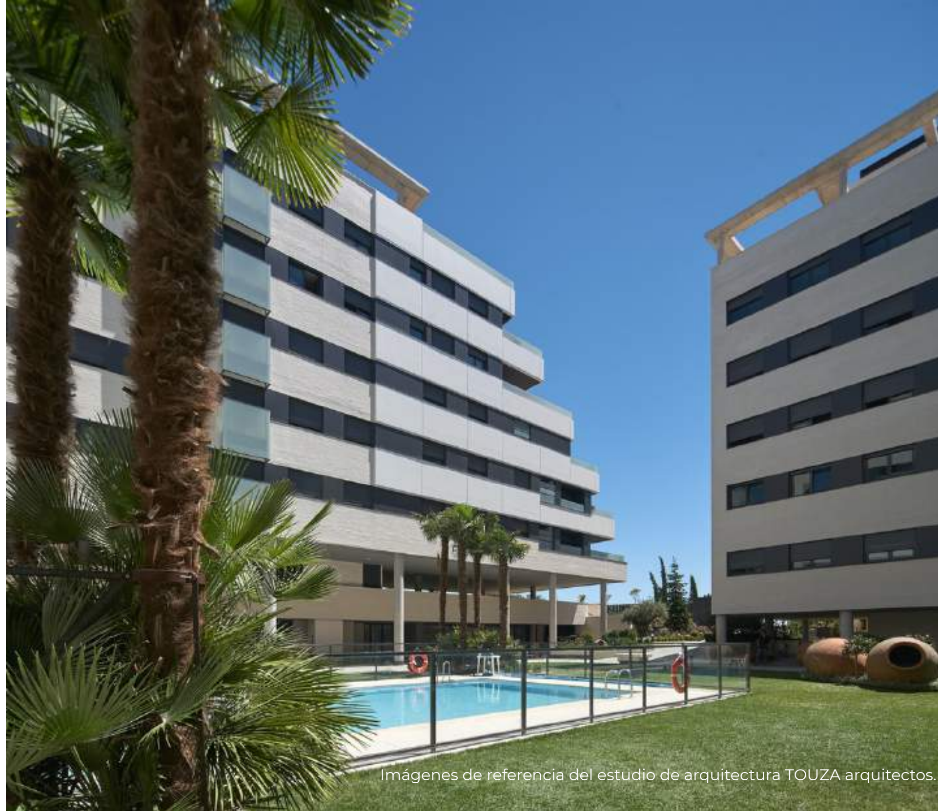
Imágenes de referencia del estudio de arquitectura TOUZA arquitectos.

La promoción trasciende el interior de la vivienda para extenderse a unas zonas comunes diseñadas para el disfrute y la desconexión de toda la familia. El proyecto cuenta con una piscina donde relajarse, un gimnasio equipado para fomentar un estilo de vida saludable y un salón social versátil para encuentros y celebraciones. Pensando en los más pequeños, la urbanización incorpora una zona infantil segura y divertida, todo ello integrado en cuidadas espacios ajardinados que crean un entorno privado de convivencia y descanso.