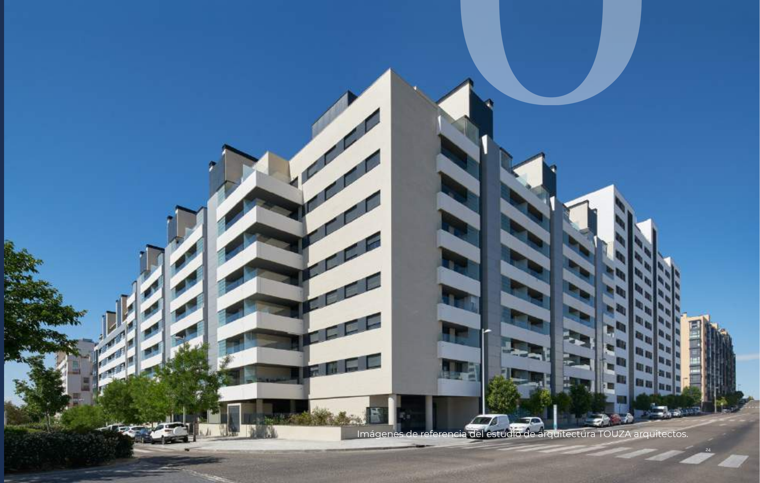
Imágenes de referencia del estudio de arquitectura TOUZA arquitectos.